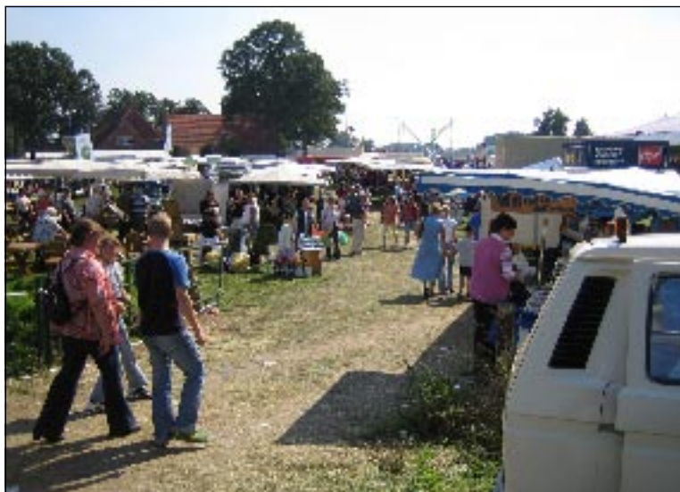
An den zahlreichen Marktständen finden Besucher zum Beispiel Handtaschen, Gartengeräte, Werkzeuge oder Reiterbedarf.