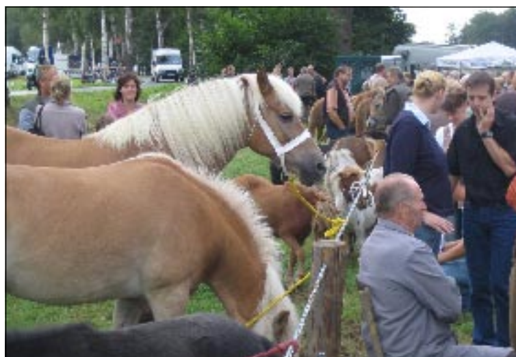
Der Pferdemarkt am Montag zieht Besucher von nah und fern an. So manch einer kommt hier ohne Kaufabsicht her und geht dann doch mit einem Pony oder Pferd am Strick wieder nach Hause.