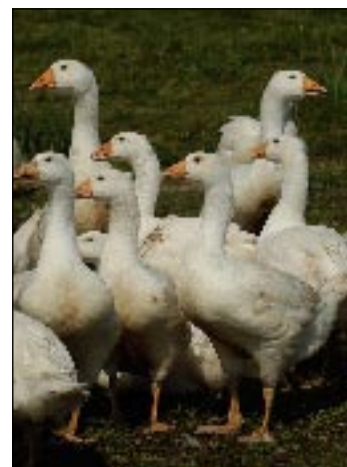
Geflügel wie Gänse, Enten oder Hühner wird auf dem Viehmarkt angeboten.

Das Veranstaltungsgelände des Düstermühlenmarktes liegt außerhalb von Legden, direkt an der L 570 von Ahaus in Richtung Schöppingen. Damit die An- und Abfahrt der zahlreichen Besucher reibungslos verläuft, wird eine spezielle Verkehrsführung eingerichtet. Für Behinderte stehen in direkter Nähe zum Markt Parkplätze zur Verfügung. Der Eintritt ist wie in den vergangenen Jahren kostenlos. □