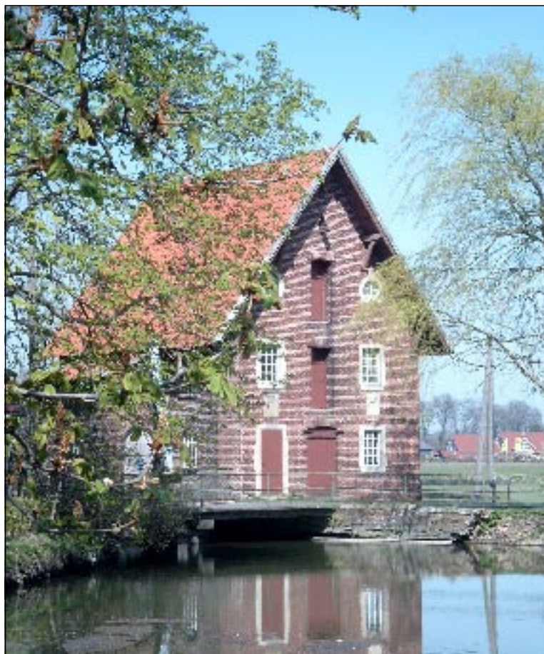
Die Düstermühle, eine alte Backsteinmühle am Ufer der Dinkel, gibt dem Düstermühlenmarkt seinen Namen. Sie wird das erste Mal 1151 in den Geschichtsbüchern erwähnt.