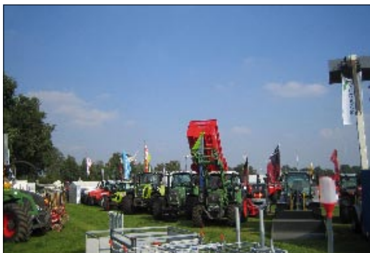
Moderne Landtechnik präsentieren die Aussteller in Legden. Trecker, Mähdrescher, Häcksler und andere Landmaschinen werden ebenso gezeigt wie Stalleinrichtungen oder Kleingeräte.

Am Montagmorgen geht es zeitig los. Um 8 Uhr beginnt der Viehmarkt mit dem Auftrieb der Pferde, Schafe und Ziegen. Angeboten werden beispielsweise auch Hühner, Gänse, Enten, Kanarienvögel, Kaninchen oder Hamster. Schon so