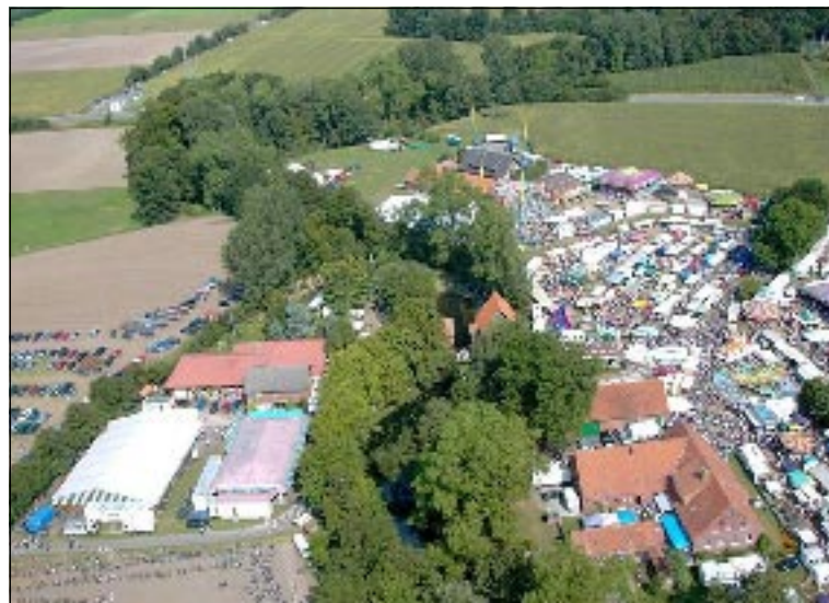
Der Düstermühlenmarkt zieht jedes Jahr um die 80 000 Besucher in die kleine Bauerschaft Wehr bei Legden.

mancher ist hier als neuer Besitzer eines großen oder kleinen Tieres vom Platz gegangen, obwohl er sich eigentlich nur umsehen wollte. Kirmes und Krammarkt sind am Montag ebenfalls geöffnet.